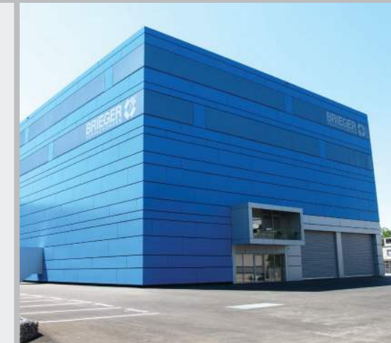
BRIEGER Verpackungen, Schlieren

Dank des Erfindergeists unserer hoch qualifizierten Mitarbeiter entwickelt BRIEGER laufend innovative Originalprodukte. Vom wegweisenden Patent für die ganze Branche bis hin zu der massgeschneiderten Lösung Ihrer individuellen Anforderung.