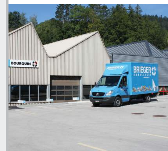
BRIEGER Emballages, Couvet