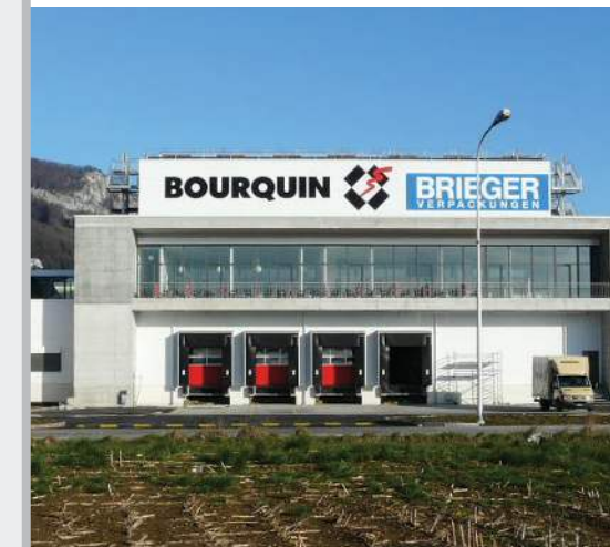
Abholungen ab Oensingen