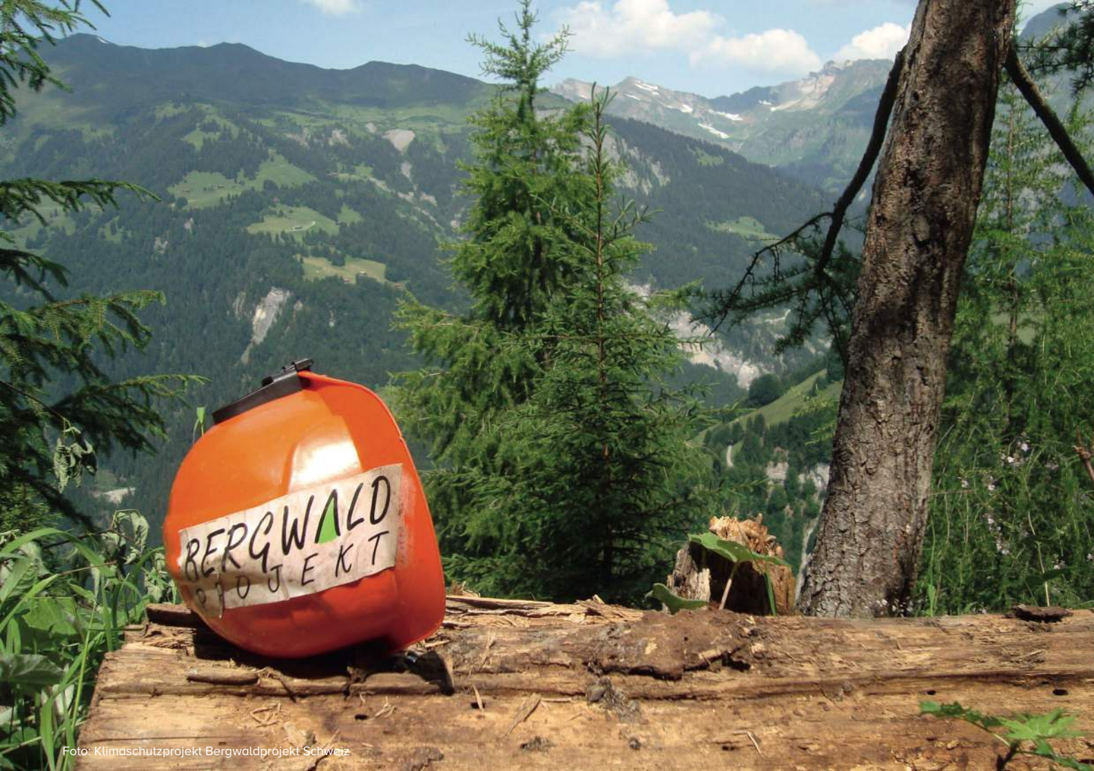
Foto: Klimaschutzprojekt Bergwaldprojekt Schweiz