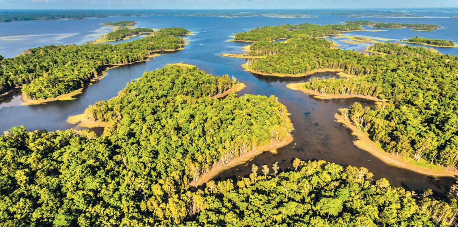
Foto: Klimaschutzprojekt Waldschutz in April Salumei, Papua-Neuguinea

CO 2 -Einsparung in April Salumei: 1,03 Millionen Tonnen pro Jahr